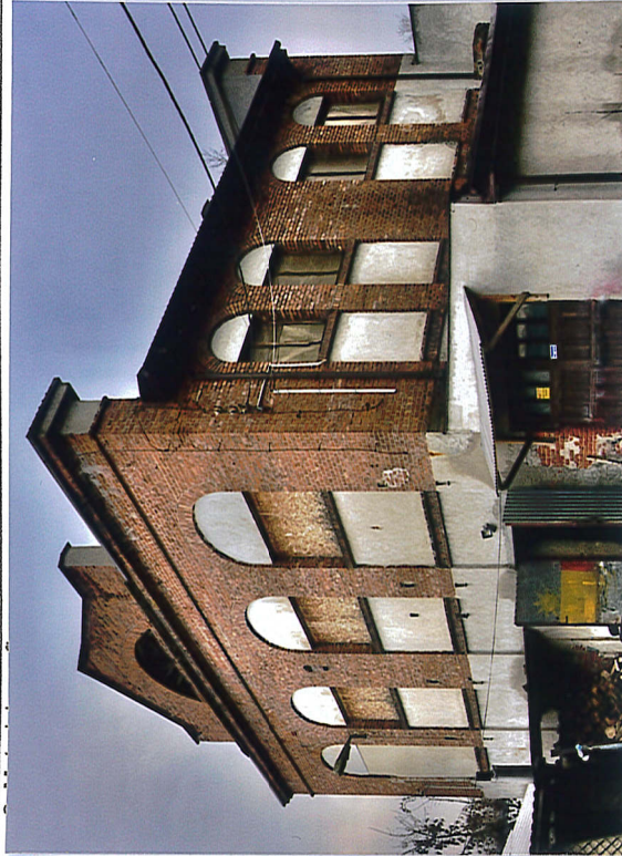
1. Elewacja wschodnia i północna, 2020.