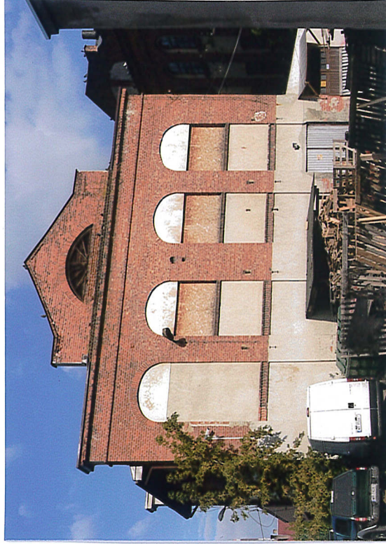
2. Elewacja wschodnia, 2020.